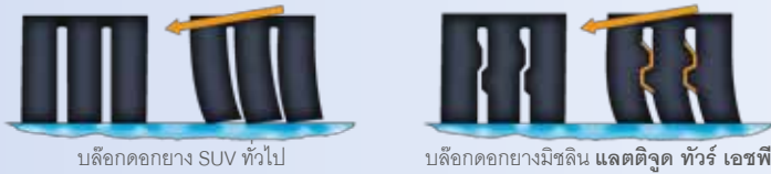
บล็อกดอกยาง SUV ทั่วไป

ด้วยเทคโนโลยีสแตบิลิกริป ช่องดอกยางที่สามารถลึกลงตัวภายใน ทำให้ดอกยางมีความมั่นคงสูง เข้าโค้งได้อย่างแม่นยำ เกาะถนนมั่นใจ ให้ความปลอดภัยสูงสุด